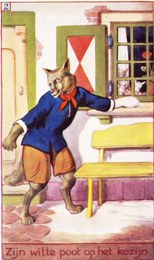
Zijn witte poot op het kozijn

deed wat de wolf vroeg. Toen werd de molenaar bang, en hij maakte met zijn meel de poot van de wolf zoo wit als sneeuw.