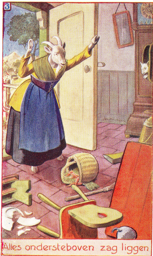
Alles ondersteboven zag liggen

enkele hap op — zoo'n honger had hij! Alleen op het kleinste geitje, dat in de klok gekropen was, had hij niet gelet.